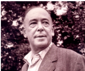
Clive Staples Lewis